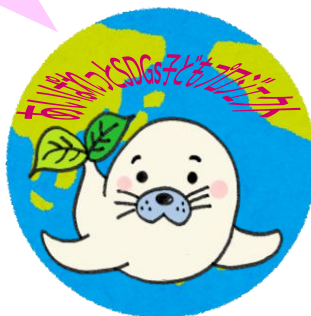
オリジナル缶パッチ